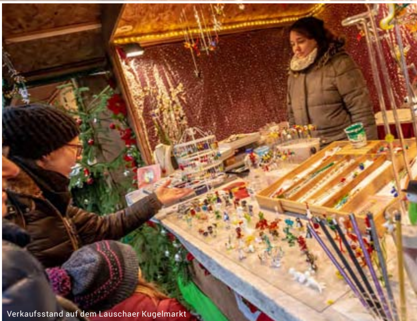
Verkaufsstand auf dem Lauschaer Kugelmarkt

Das Weihnachtsland erstreckt sich von Masserberg bis Sonneberg, mit dem Geburtsort Lauscha im Zentrum. Das Leitevent „Lauschaer Kugelmarkt“ bildet dabei den Kern des Markenerlebens. Im Rahmen des Markenversprechens gilt es dabei, die Eventqualität und -quantität des Leitevents, aber auch anderer Veranstaltungen in der Gebietskulisse weiterzuentwickeln. Veranstalter anderer Weihnachtsmärkte und Highlights in der Region profitieren als offizieller Lizenzpartner davon.