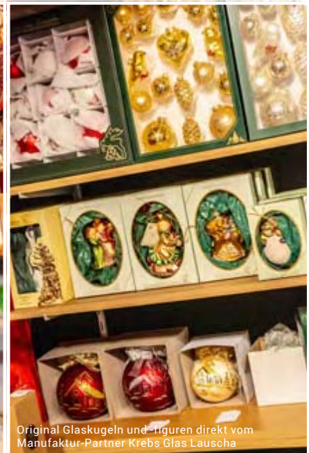
Original Glaskugeln und -figuren direkt vom Manufaktur-Partner Krebs Glas Lauscha