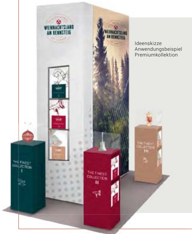
Ideenskizze Anwendungsbeispiel Premiumkollektion

Eine Premiumkollektion sorgt im stationären Handel für Bekanntheit und weckt Begehrlichkeiten. Christbaumschmuck der Marke „Weihnachtsland am Rennsteig“ erfüllt diese durch ihr Markenversprechen „mundgeblasen und handbemalt“. Die Christbaumkugel im Markensymbol wird dabei zur echten Glaskugel – als das greifbare Original unter den Originalen im Manufaktursortiment. Hersteller können sich für die Produktion einer solchen „Masterkugel“ bewerben und diese unter Lizenz eigenständig vertreiben.