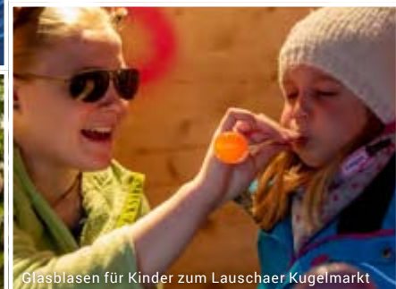
Glasblasen für Kinder zum Lauschaer Kugelmarkt