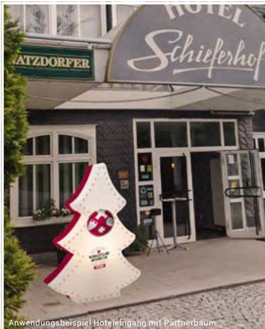
Anwendungsbeispiel Hoteleingang mit Partnerbaum

Touristische Partner von „Weihnachtsland am Rennsteig“ profitieren dabei von einem saisonübergreifenden Marketing, das die Zielgruppen über die Saison hinaus anspricht. Durch speziell auf die Marke ausgerichtete Angebote, Arrangements, Tages- oder Rahmenprogramme, können sich Hoteliers, Gastronomen und andere touristische Akteure am Erfolg der Destinationsmarke beteiligen.